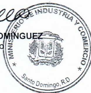
ING. JUAN TEMISTOCLES MONTAS DOMÍNGUEZ Ministro de Industria y Comercio

DADA y firmada en la Ciudad de Santo Domingo, Distrito Nacional, Capital de la República Dominicana, a los treinta (30) días del mes de septiembre del año dos mil diez y seis (2016).